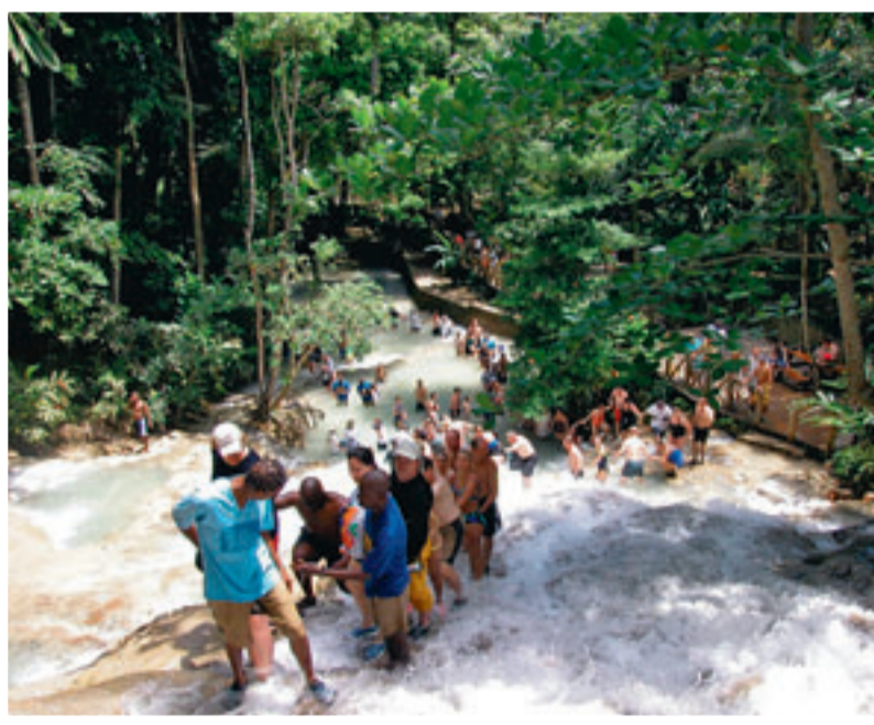
De Dunn's River Falls zijn als een gigantische trap in de rivier. In een menselijke ketting kun je ze vrij makkelijk beklimmen.