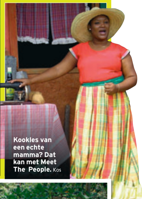
Kookles van een echte mamma? Dat kan met Meet The People. Kos

INFO: www.visitjamaica.com www.ontdekjamaica.nl http://islandbuzzjamaica.com www.bobmarley.com www.goldeneye.com www.jamaicatavel.com/meetthe-people